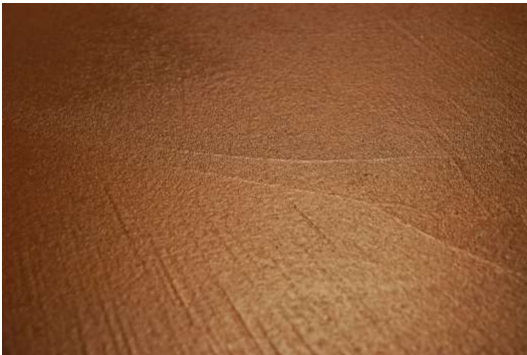
Detail Naturofloor Bodenbelag