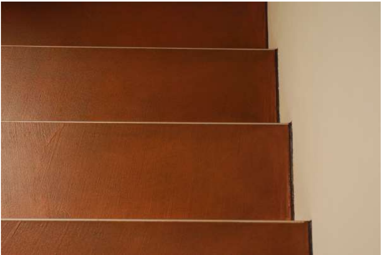
Aufsicht Treppe mit Naturfloor Bodenbelag. Anschluss an Kalkputz