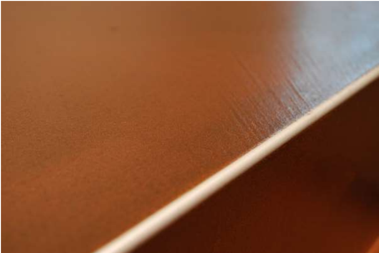
Detail Naturopfloor mit Treppenkantenprofil

Naturopfloor ist der hochwertige, handgefertigte Designbelag für Oberflächen die wirken. Er besteht aus mineralischen Materialien und lässt sich fugenlos auf Böden und andere horizontale Flächen aufbringen. In vielen verschiedenen Standardfarbtönen und als Variationen mit Metallbronzen. Die Mischung aus mineralischen Rohmaterialien ist äusserst pflegeleicht, rissfest und strapazierfähig - ein echtes Schweizer Qualitätsprodukt.