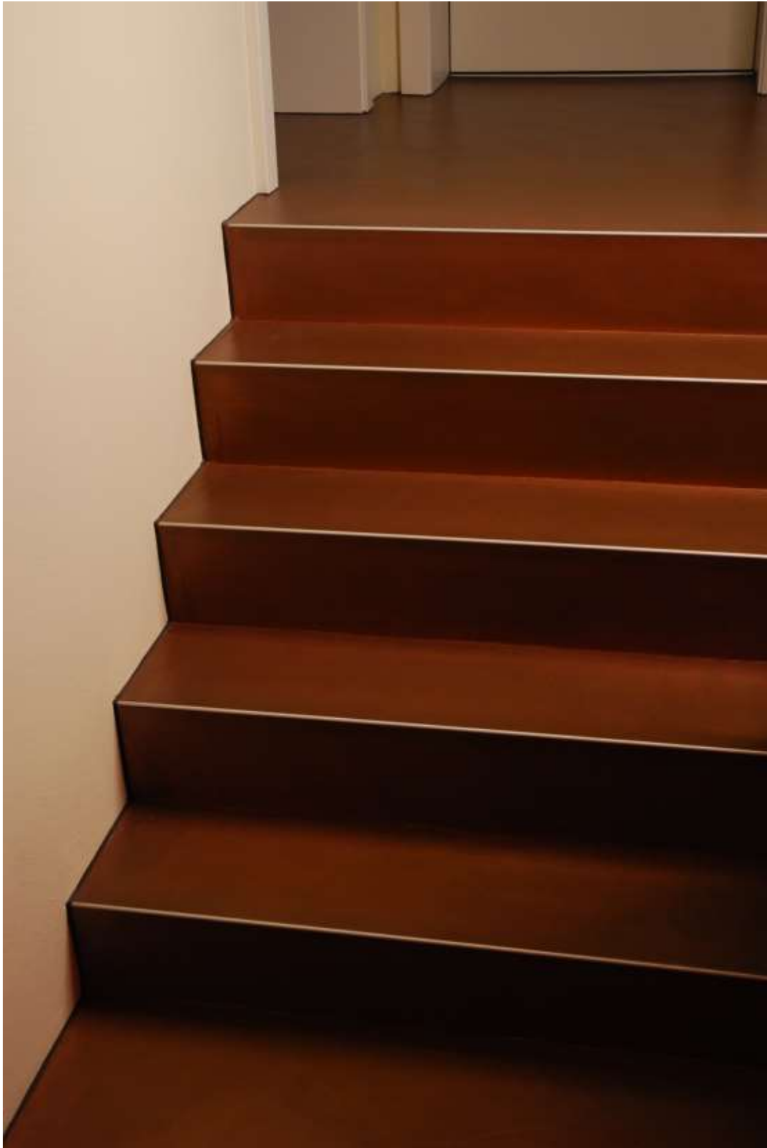
Treppe mit Naturofloor Bodenbelag. Anschluss an Kalkputzwand