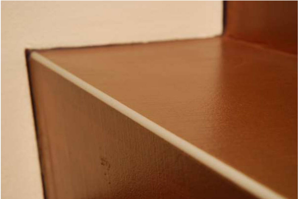
Detail Naturfloor mit Treppenkantenprofil